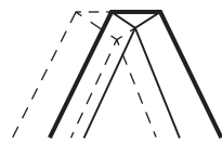
Limer la moitié de la surface plane.

L'affûtage des dents fait disparaître le plat créé lors du dressage. Les deux tranchants de la dent sont limés l'un à la suite de l'autre. Limer le premier tranchant jusqu'à ce que la moitié du plat ait disparu; faire de même avec le second tranchant. En procédant de la sorte, toutes les dents auront la même hauteur.